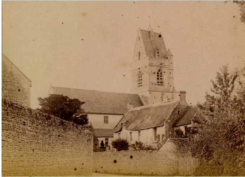
Figure 1 - Vue de l'église au XIX e siècle

A la fin du XI e siècle, Guillaume Fitz Osbern, compagnon de Guillaume le Conquérant, céda le patronage de l'église de Crépon à l'abbaye de Corneilles (Eure) qu'il avait fondée. L'église conserve des éléments architecturaux d'époque médiévale : tour-clocher (XII e , XIV e XV e siècles), chœur (XII e , XIV e siècles), façade ouest et chapelles latérales (XIII e siècle). La nef du XII e siècle a été remaniée au XIX e siècle. Un décor exceptionnel est conservé : dans la chapelle nord, un retable de pierre à colonnes torsadées du XVII e siècle (statues des saints Médard et Gildard du XIX e siècle) ; dans l'avant-chœur et le chœur, lambris de chêne sculpté, stalles, autel-double et lutrin du XVIII e siècle (ensemble attribué à Jacques Moussard, architecte, et à Jean-Louis Mangin, sculpteur). Au chevet, une toile monumentale du XVIII e siècle, l'Élévation de la Croix d'après une œuvre de Charles Le Brun, a fait l'objet d'une opération de conservation-restauration en 2022-2023. La sépulture des parents et de la sœur de l'archéologue, Arcisse de Caumont (1801-1873), est signalée par un panneau fixé sur le muret du cimetière côté sud.