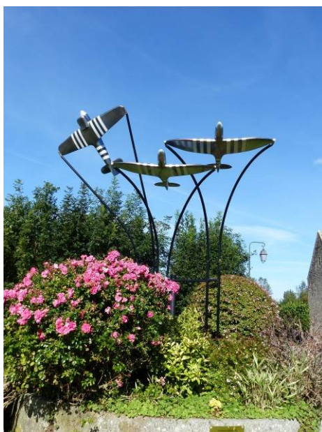
Figure 12 - Mémorial des aviateurs belges

En face de la ferme-manoir de La Rançonnière, le mémorial érigé en hommage aux pilotes et aux personnels de soutien belges incorporés dans la Royal Air Force (R.A.F.) pendant la dernière guerre a été inauguré le 23 mai 2019. Placé au centre d'un « tour à piler », auge en pierre destinée au broyage des pommes à cidre, ce monument réaliste représente trois avions de chasse britanniques en plein vol. A proximité du monument, deux panneaux présentent, d'une part l'action des pilotes belges au sein des forces aériennes britanniques de 1940 à 1945, d'autre part le dépôt de vivres n°2 installé par le Royal Army Service Corps , en juin 1944, dans la ferme de La Rançonnière.