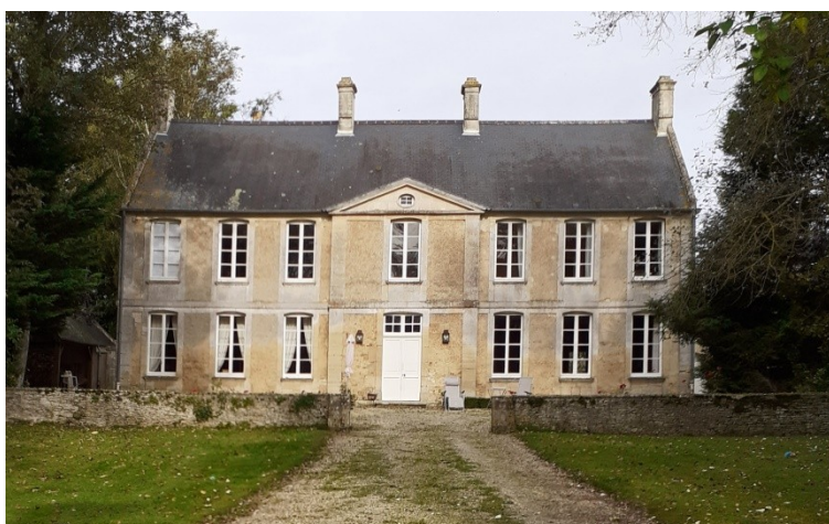
Figure 3 - Corps de logis de l'ancien presbytère

Le mur de clôture se creuse élégamment de part et d'autre d'un portail monumental encadré par deux piliers arrondis délicatement moulurés et reliés par un arc aujourd'hui disparu. Ce portail donne accès à la basse-cour, bordée à l'origine par des communs, qui précède la cour d'honneur sur laquelle donne la façade principale du logis élevé sur deux niveaux percés chacun de sept hautes ouvertures. Traité comme un hôtel particulier, ce bâtiment présente sous un vaste fronton un peu aplati un avant-corps central, qui abrite le vestibule et l'escalier principal, et comporte à l'arrière deux courtes ailes en retour.