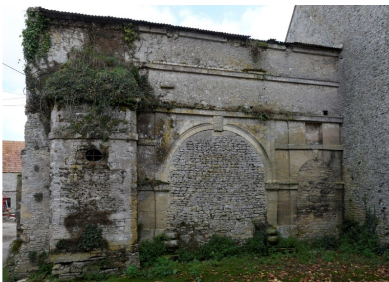
Figure 15 - Corps d'entrée du manoir de Lérondel

Le manoir appartenait à la famille Hüe de Lérondel qui résidait à Crépon entre le milieu du XVII e siècle et la première moitié du XIX e siècle. Le corps de logis date du XVII e siècle. Sur la rue, un superbe corps d'entrée d'influence italienne (XVII e siècle) est divisé en trois travées : au centre une porte charretière et à droite une porte piétonne, l'une et l'autre murées. Sur la gauche une bretèche (ou tourelle) percée d'un oculus repose sur le sol. La clef et les impostes des piédroits de la porte charretière sont vermiculées. Les bases de ces mêmes piédroits sont protégées par des chasse-roues en forme de boulets superposés.