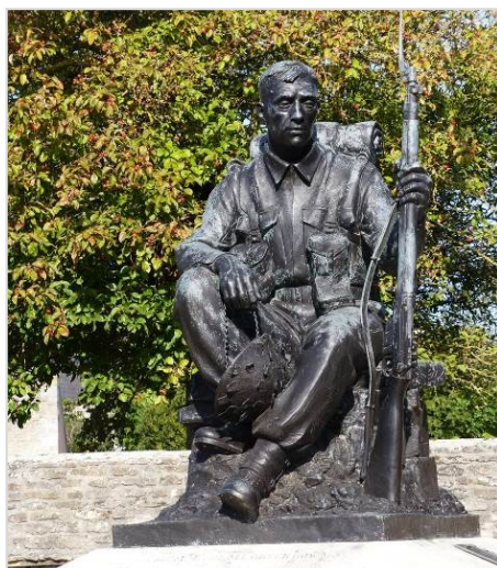
Figure 9 - Statue d'un soldat britannique

Le mémorial érigé en hommage aux soldats des Green Howards a été inauguré le 26 octobre 1996 par le roi de Norvège, Harald V, colonel in chief de ce régiment britannique, qui s'est brillamment illustré après son débarquement, le 6 juin 1944, à Gold Beach (Normandie).