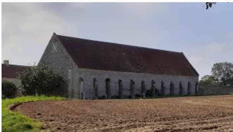
Figure 6 - Grange à dîme vue du côté des champs

En bordure de la plaine, s'élève la grange à dîme, bâtiment rectangulaire aux proportions exceptionnelles, dont les quatre murs sont flanqués extérieurement de puissants contreforts. Côté cour, son vaisseau unique est percé de deux portes charretières, l'une dans le pignon nord et l'autre dans le mur gouttereau, qui présente lui-même plusieurs ouvertures en plein cintre protégées par un auvent.