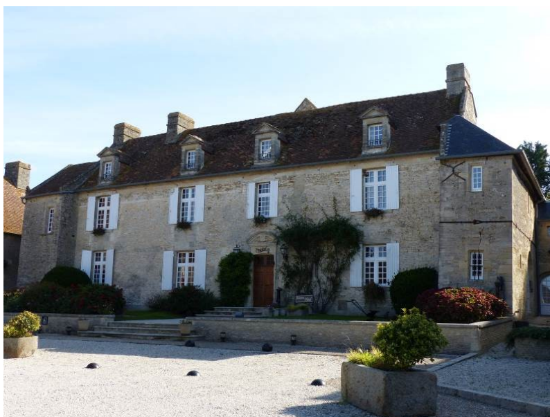
Figure 14 - Façade sur cour du logis de La Rançonnière

Le portail monumental, constitué d'une porte charretière flanquée à droite d'une porte piétonne et à gauche d'une porte factice bien appareillée symétrique de la précédente, présente des éléments de défense ostentatoires sans doute peu efficaces en cas d'assaut : la partie centrale couronnée d'un parapet crénelé décoratif est encadrée de bretèches couvertes de dômes de pierre sous lesquels de modestes meurtrières ont été percées.