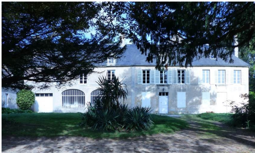
Figure 4 - Façade sud du manoir de la Baronnie

Le portail à claire-voie laisse apercevoir le logis qui a été profondément remanié au XVII e siècle (tour d'escalier en vis située à l'arrière du bâtiment) et au XIX e siècle (façade principale). Subsistent un mur de refend du XII e siècle et un escalier à volées droites du début du XVIII e siècle.