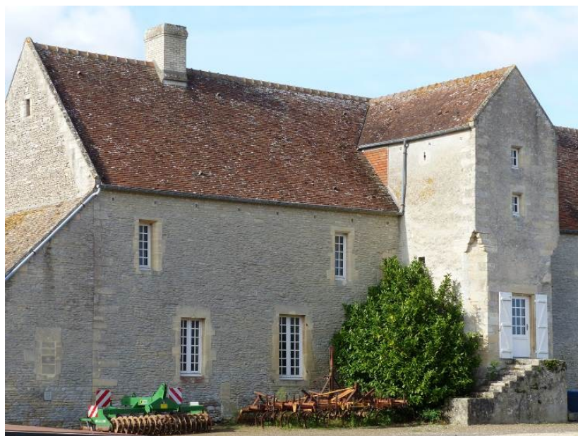
Figure 5 - Façade est du logis de la ferme de la Baronnie

Le domaine de la Baronnie relevait de l'abbaye Notre-Dame-de-Cormeilles (Eure) depuis le XI e siècle. Les bâtiments de la ferme se distribuent autour de deux vastes cours fermées par de hauts murs. Le logis (XVI e -XVII e siècles) est imposant et comporte en saillie une tour d'escalier quadrangulaire comme plusieurs manoirs de Crépon. On relève également la présence de meurtrières (arquebusières) sur la tour d'escalier et le mur de la propriété.