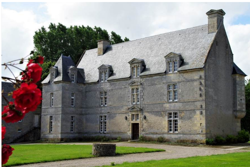
Figure 11 - Façade sur cour de la Grande ferme

Les lucarnes géminées sont surmontées de frontons triangulaires, de même que les autres ouvertures de la travée centrale encadrées d'assises en harpe. Sous le fronton de la porte d'entrée, deux petites fenêtres ont été percées. Côté jardin, la façade traitée plus sobrement est complétée aux angles par des bretèches relativement volumineuses.