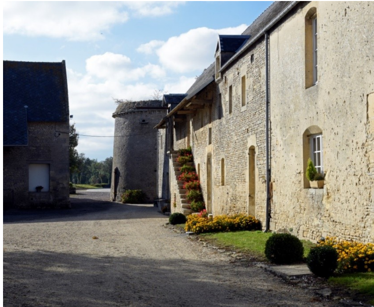
Figure 17 - Ferme du Colombier