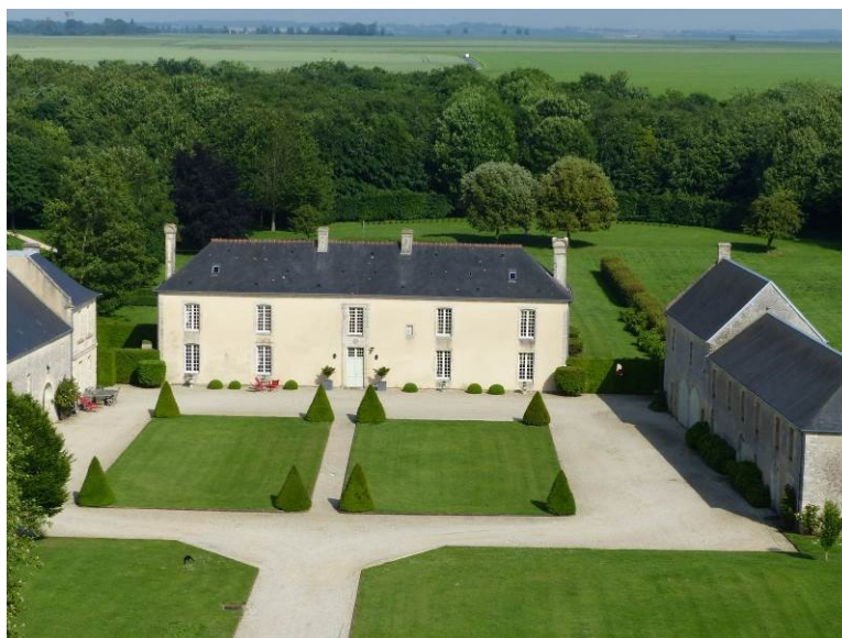
Figure 7 - Maison de Blais vue du clocher

A travers la grille, on découvre un corps de logis construit probablement dans le courant du XVII e et aménagé au XVIII e siècle pour la famille Le Blais qui acquit la seigneurie de Crépon en 1688. Des modifications furent apportées au XIX e siècle : remaniement du logis, démolition d'un colombier, comblement de douves.