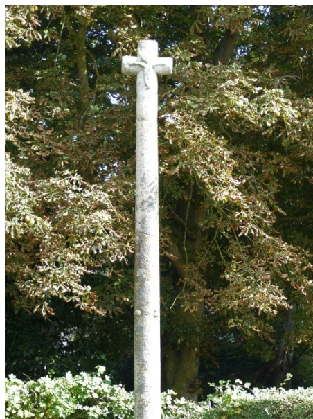
Figure 20 - Calvaire

Calvaire (intersection de la route de Bayeux et de la rue du Calvaire)