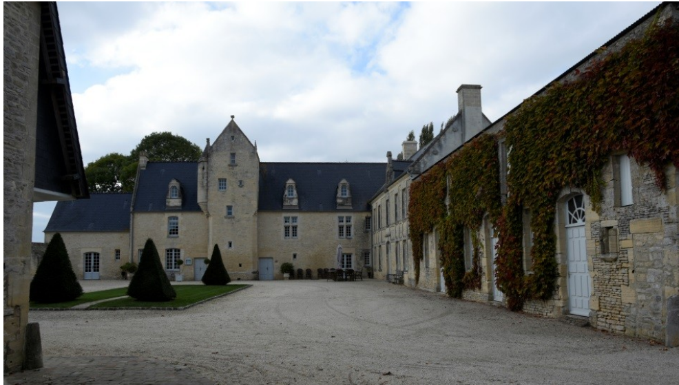
Figure 16 - Façade est du manoir du Clos de Mondéville

Au-dessus de l'égout du toit du logis, s'élève une tourelle d'escalier en encorbellement sur un cul-de-lampe figurant un personnage ailé qui soutient un écriteau où se lit la date de 1560 et les initiales M. H. Coiffée en poivrière, la tourelle dessert de petites pièces superposées logées en haut de la tour dont la couverture en bâtière s'orne de fleurons. L'élévation de la tour et son élégante décoration lui confèrent l'allure d'un petit donjon médiéval qui atteste de la noblesse de son propriétaire.