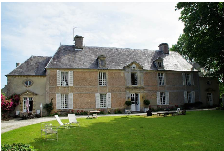
Figure 21 - « Manoir » de Crépon

Maison de maître fin XVII e siècle ou début du XVIII e siècle, baptisée le Manoir de Crépon , dont le corps principal est divisé par des bandeaux horizontaux et verticaux, et qui comporte deux niveaux percés chacun de cinq grandes ouvertures, ainsi que deux lucarnes de part et d'autre de la travée centrale en avant-corps surmontée d'un fronton. La travée centrale abrite un vestibule qui ouvre sur les deux façades de la maison et donne accès à un escalier à volées droites.