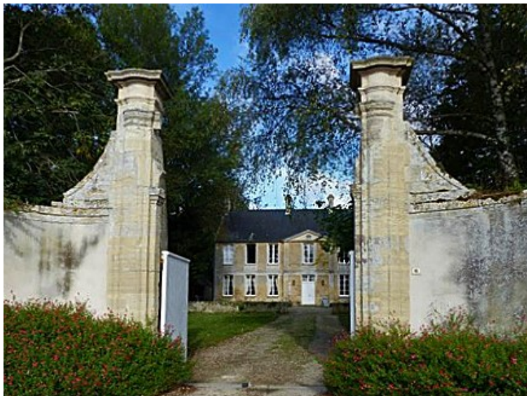
Figure 2 - Portail de l'ancien presbytère

Le somptueux presbytère édifié au milieu du XVIII e siècle d'après un devis établi par l'architecte bayeusain, Jacques Moussard (1674-1750), fut probablement financé grâce aux revenus substantiels du curé qui percevait la moitié du produit de la dîme.