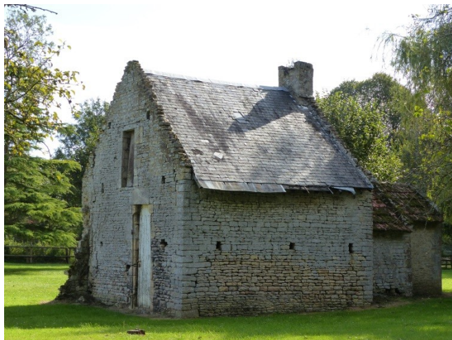
Figure 19 - Fournil du manoir de Mathan