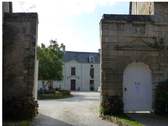
Figure 18 - Portail du manoir de Mathan

Le fief a appartenu à la famille Hüe de Mathan pendant deux siècles (XVII e -XVIII e siècles), puis par mariage aux Marguerit de Clouay de Rochefort et à leurs descendants jusqu'à la fin du siècle dernier. Le logis du XVII e siècle, dont l'avant-corps étroit et peu profond est couronné d'un fronton ramassé, a été agrandi au siècle suivant.