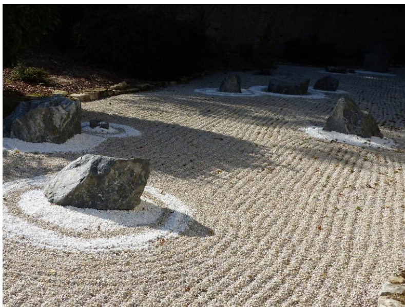
Figure 10 - Jardin japonais du manoir de Verdin

Le logis a été construit au XVII e siècle et remanié au XVIII e siècle. Donnant sur la route de Creully, un exceptionnel jardin sec ( Karesansui ) d'inspiration japonaise, créé par les propriétaires du manoir de Verdin, s'offre à la méditation du promeneur.